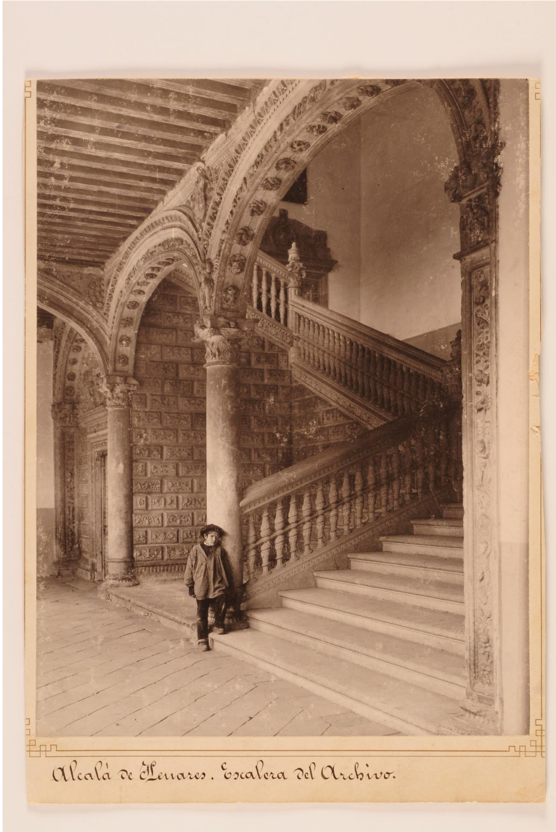
Alcalá de Segovia. Escalera del Archivo.