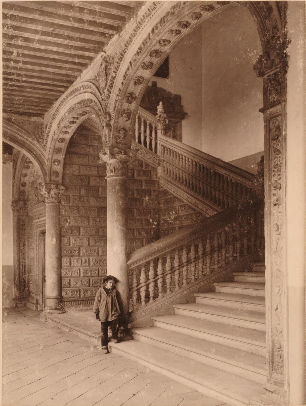
Alcalá de Llanes. Escalera del Archivo.