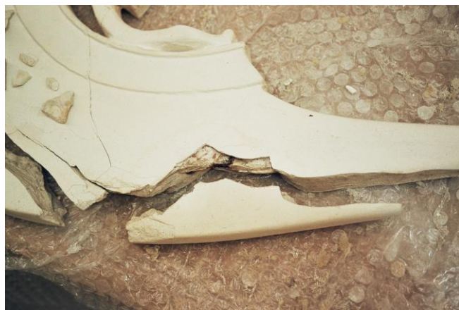
Judit Gasca Miramón