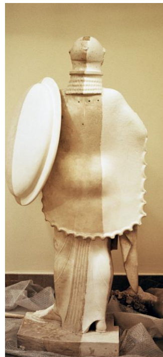
Judit Gasca Miramón