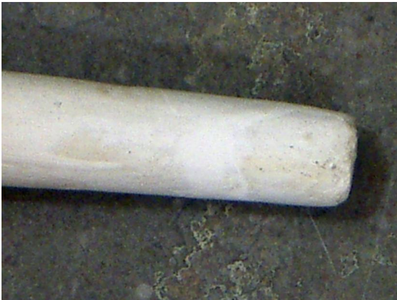
Judit Gasca Miramón