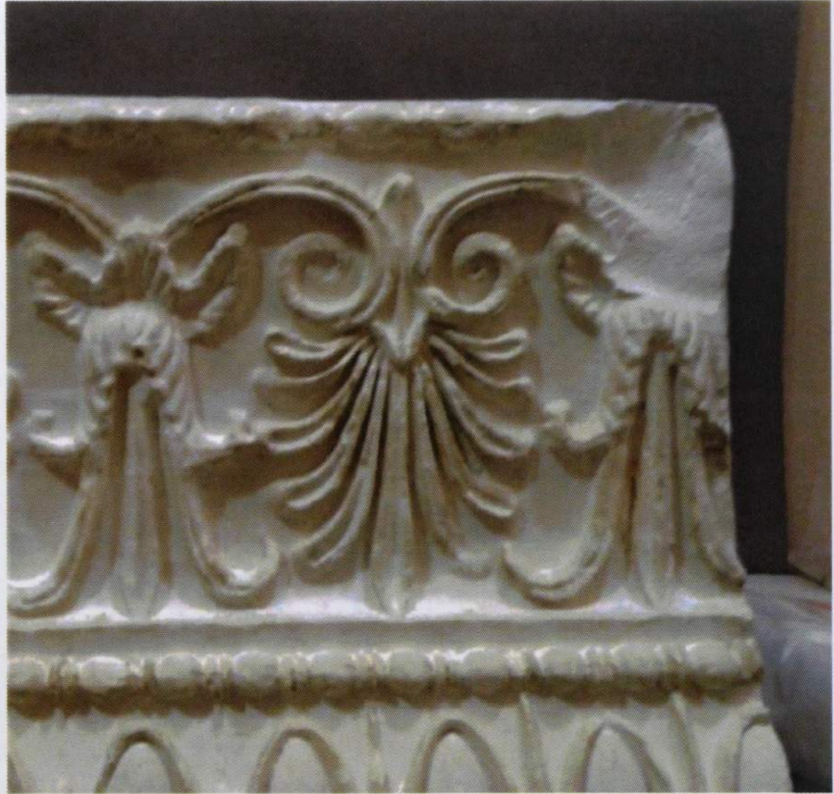
Eliminación del Anjusil® una vez seco y resultado de la limpieza.