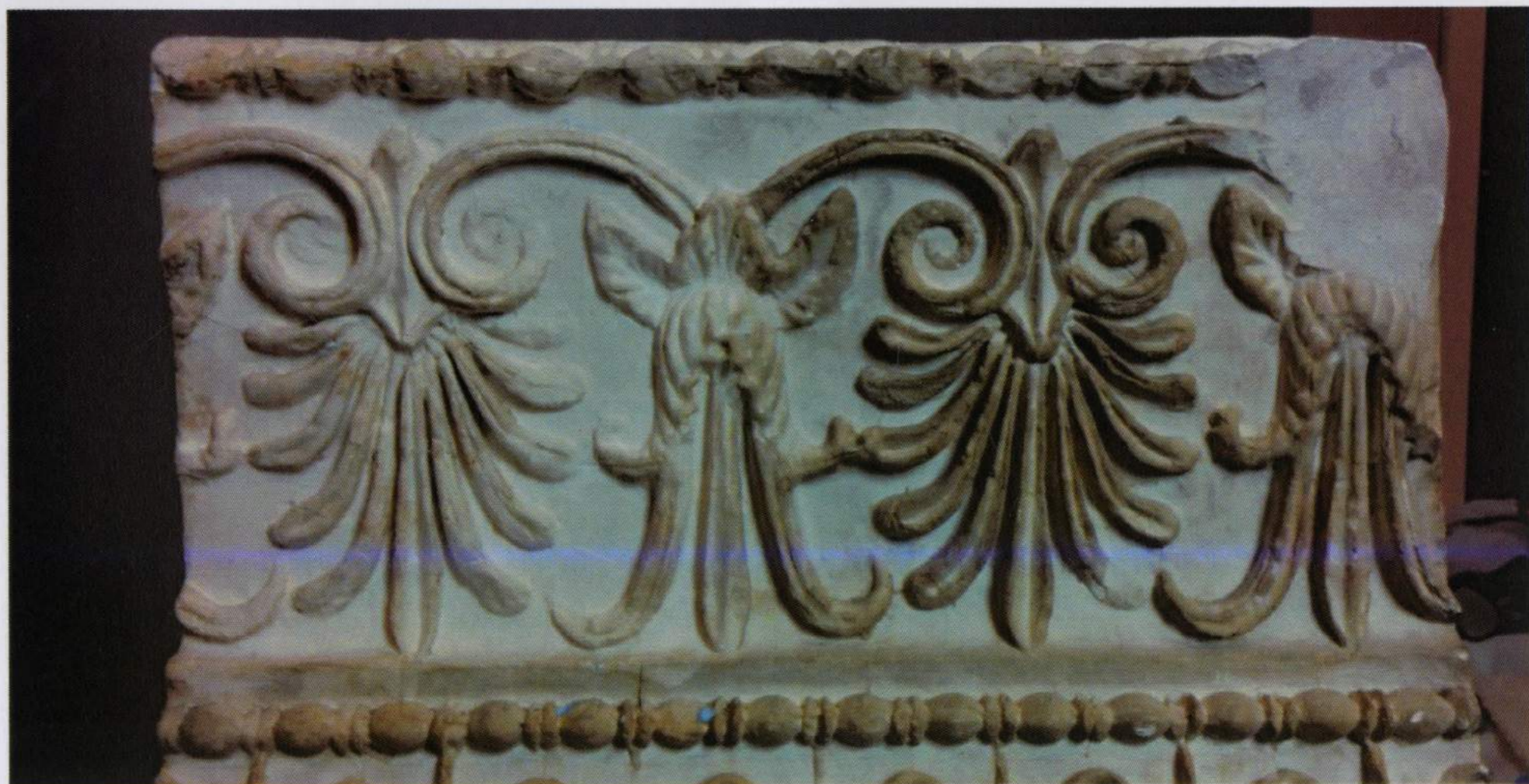
Limpieza físico-química: aplicación de Anjusil® con brocha y eliminación de la capa de suciedad.