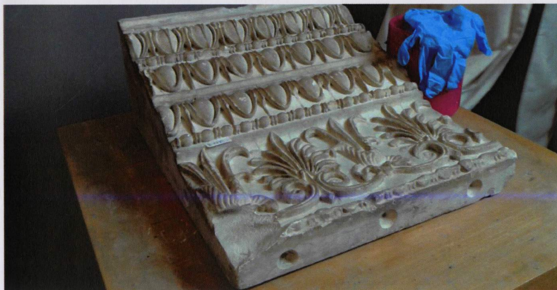
Detalles del estado de conservación: suciedad depositada, manchas oscuras en los salientes, pérdidas volumétricas, manchas,...