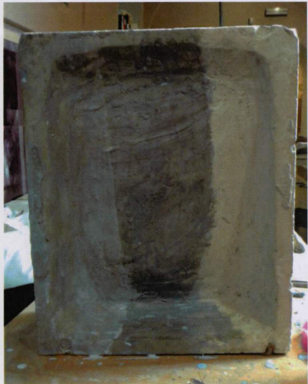
Limpieza con Anjusil® por el reverso