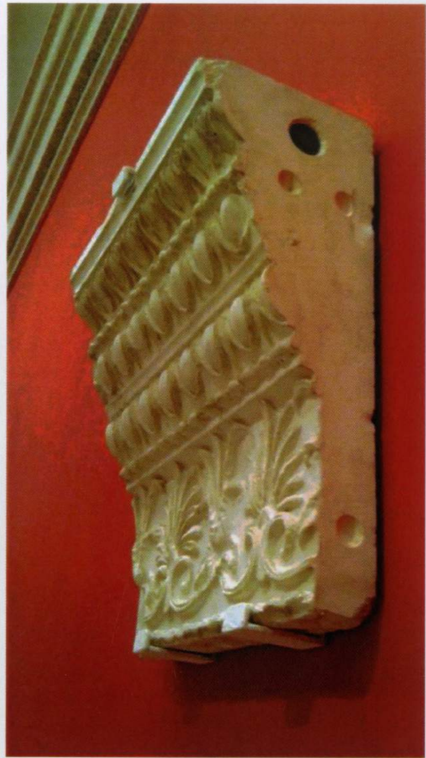
Obra expuesta en las salas de la RABASF