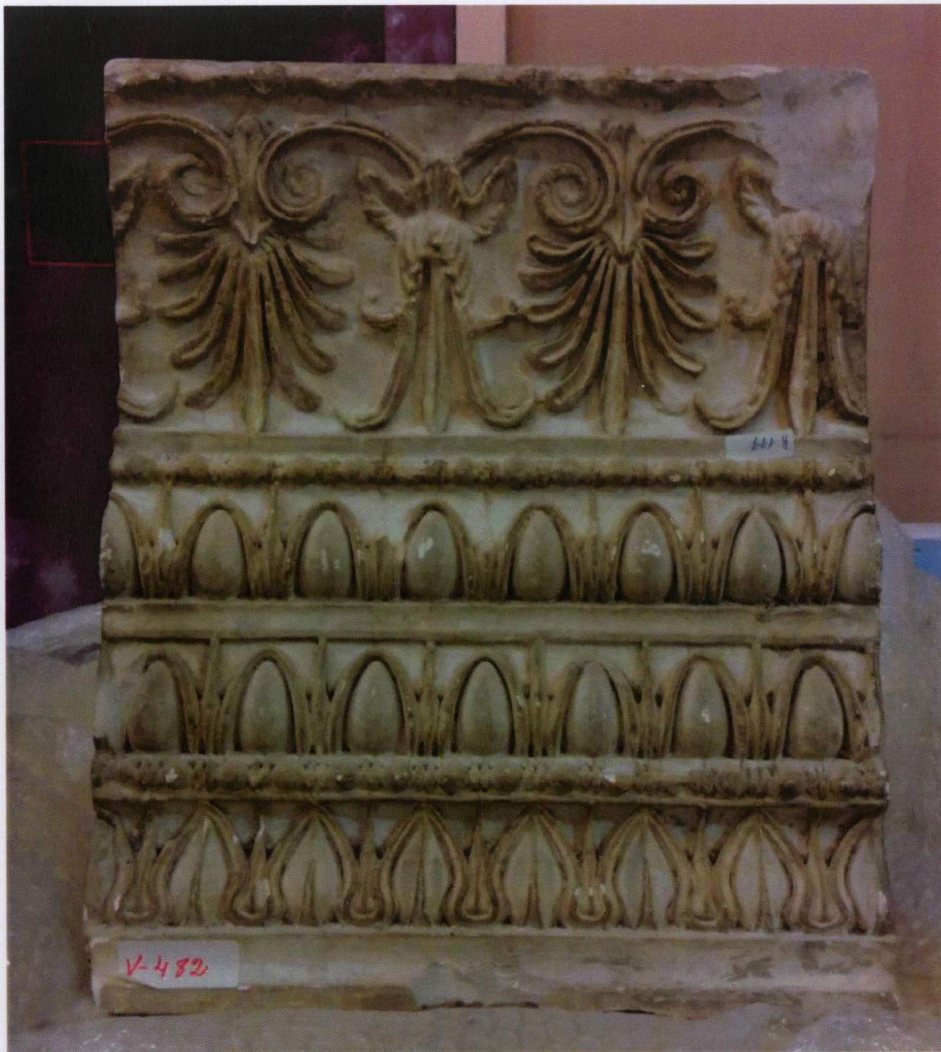
Estado de conservación de la obra antes de su restauración.