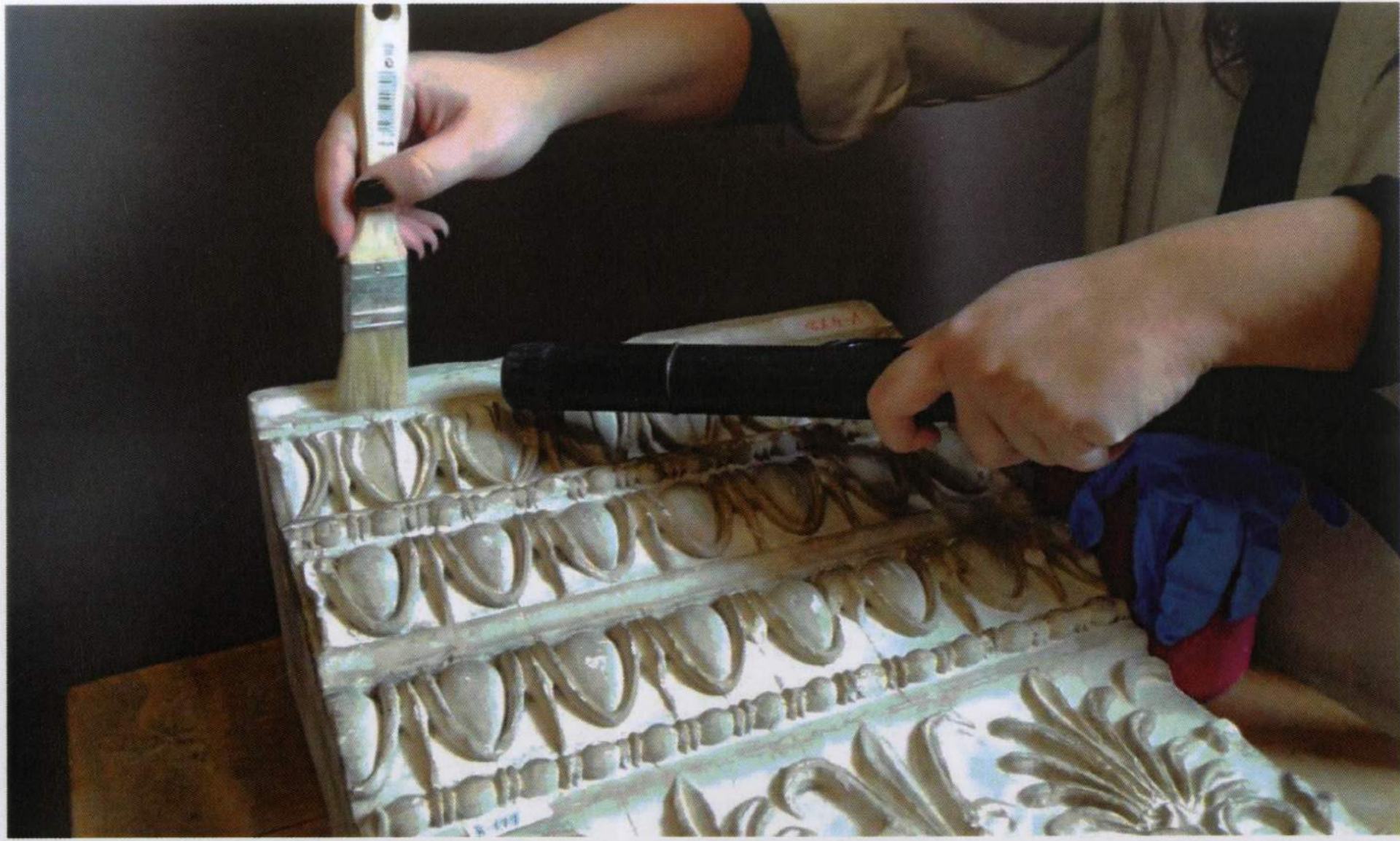
Limpieza mecánica superficial para eliminar el polvo depositado