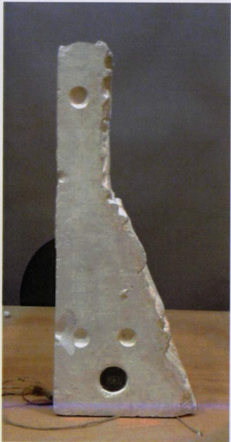
Fotografías finales de la intervención.