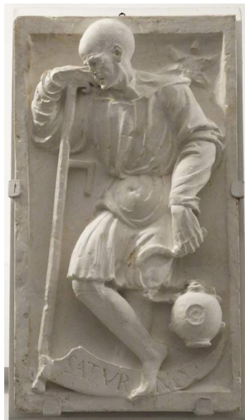
V-384 Vaciado de la dovela central o clave representando s Saturno (RABASF)

Se trata de un vaciado hueco. Realizado a partir de un molde rígido de piezas. No se aprecian las costuras ya que han sido repasadas. Realizado en un único tipo de escayola, blanca y fina. Posiblemente mediante dos volteos.