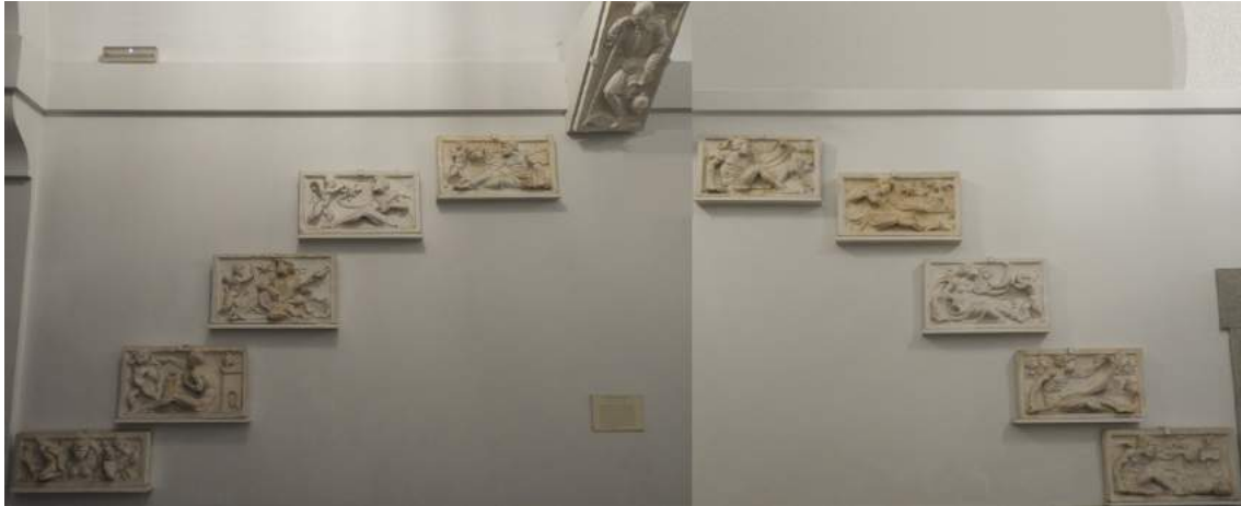
Montaje de las copias de las dovelas del intradós de la Iglesia de El Salvador en Úbeda que conserva la Real academia de Bellas Artes de San Fernando