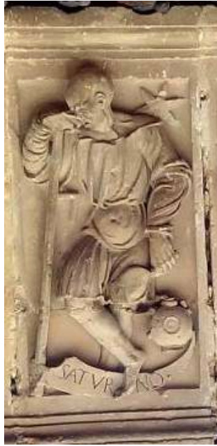
Dovela original realizada en piedra (IGLESIA DE EL SALVADOR, ÚBEDA)

El vaciado que nos ocupa representa a Saturno, y se encuentra en la clave del intradós.