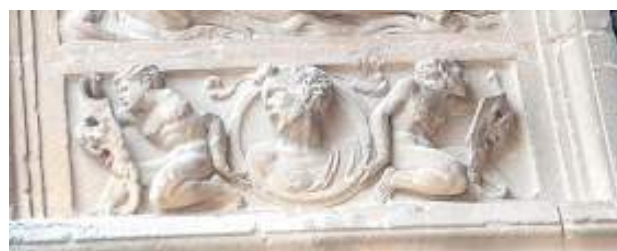
Dovela original realizada en piedra colocada en la línea de impostas izquierda. Sería la pieza que le faltaría a la Academia