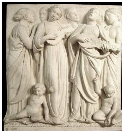
V-319 Vaciado conservado en RABASF

Se trata de un vaciado realizado en un molde abierto por el reverso de manera que se puede aligerar el peso de la pieza dejando hueca la parte trasera. Conserva por el reverso un refuerzo con una varilla de hierro colocado en horizontal en la parte superior. Está realizado en un único tipo de yeso, este bastante blanco y puro. La tonalidad anaranjada del vaciado al iniciar su restauración proviene de la impregnación de desmoldeantes para realizar copias de él. Realizado a partir de un molde rígido de piezas, donde no se pueden