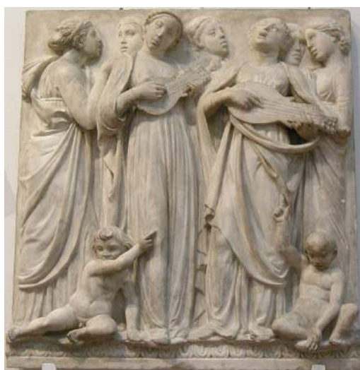
Relieve en mármol de la Cantoría original