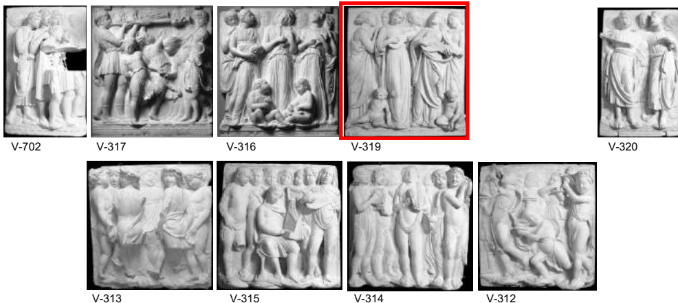
VACIADOS PERTENECIENTES A LA CANTORIA DE LUCCA DELLA ROBBIA (RABASF)

El vaciado que nos ocupa corresponde al 3er relieve de la fila superior empezando por el lado derecho. El Museo actualmente conserva 9 relieves de dicha cantoría.