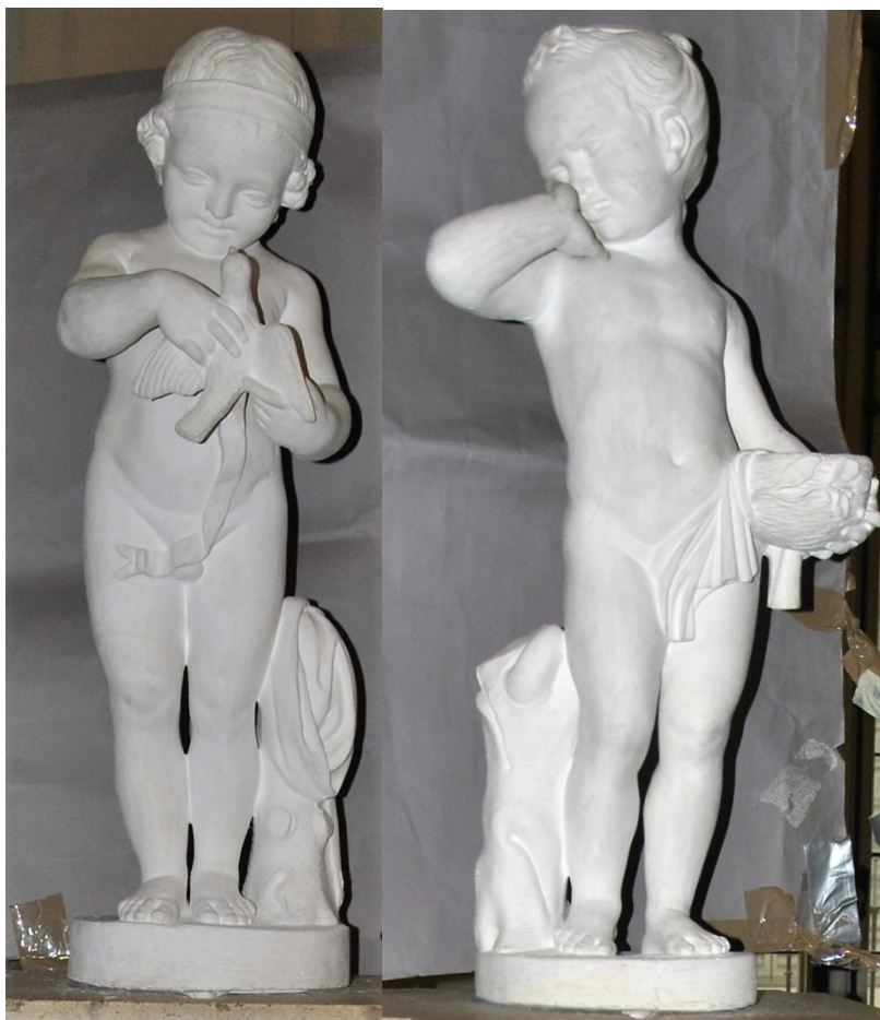
Ilustración 1, foto final niño con pájaro y niña con nido.