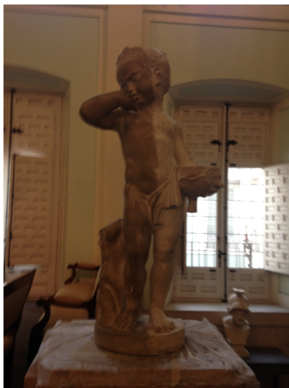
Ilustración 2, media limpieza.