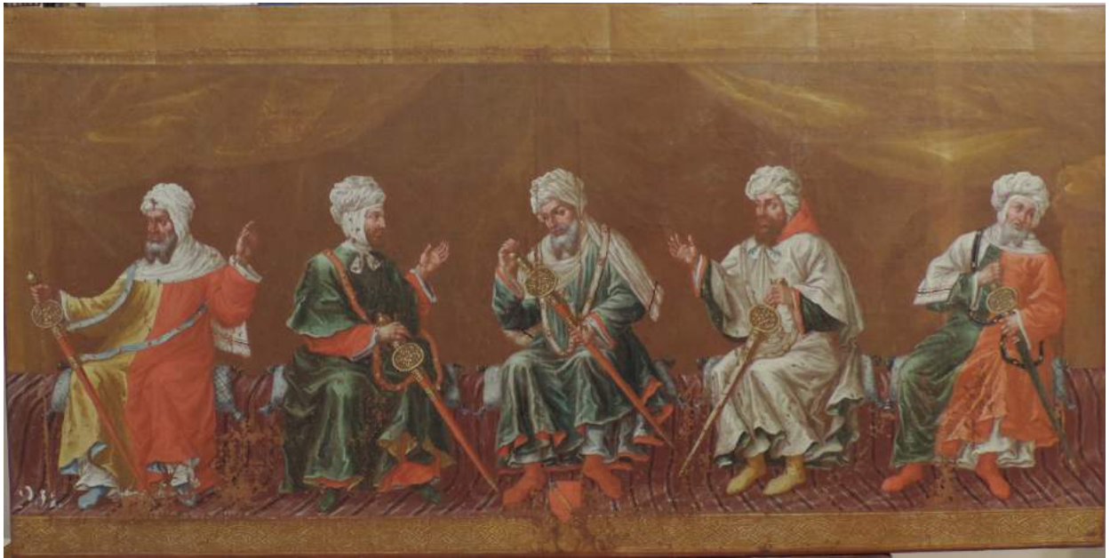
Estado una vez finalizada la limpieza de la superficie.