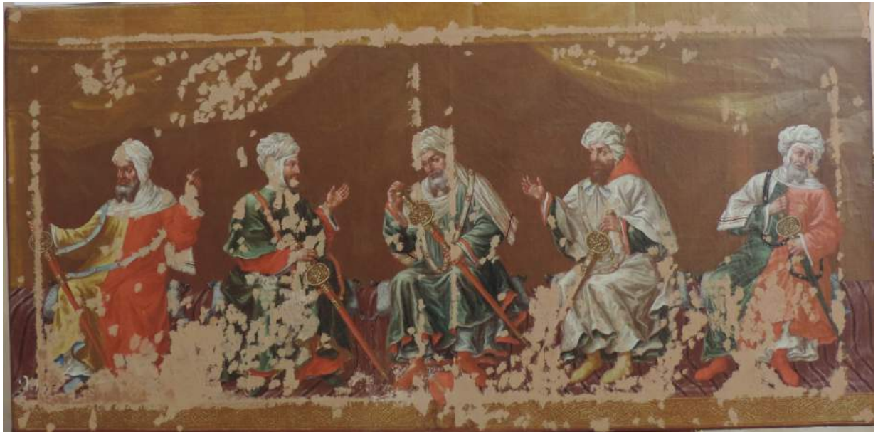
Fase de estucado de todas las pérdidas de capa pictórica