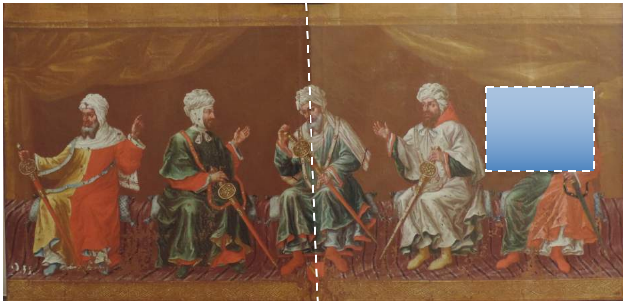
Durante la eliminación de la contaminación ambiental y barniz oxidado