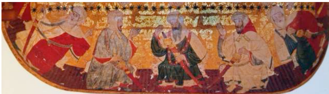
Escena de 5 personajes (reyes) sentados. Pintura al temple sobre cuero de finales del S-XIV y principios del S-XV. Sala de los Reyes del Palacio de los Leones, La Alhambra, (Granada).

pintados, en lugar de la cubierta común original, quedando el trasdós de los techos sin aireación, lo que produjo el consiguiente deterioro. A finales de 2006 se realizó un proyecto de restauración de las cubiertas con el fin de frenar su deterioro 2 .