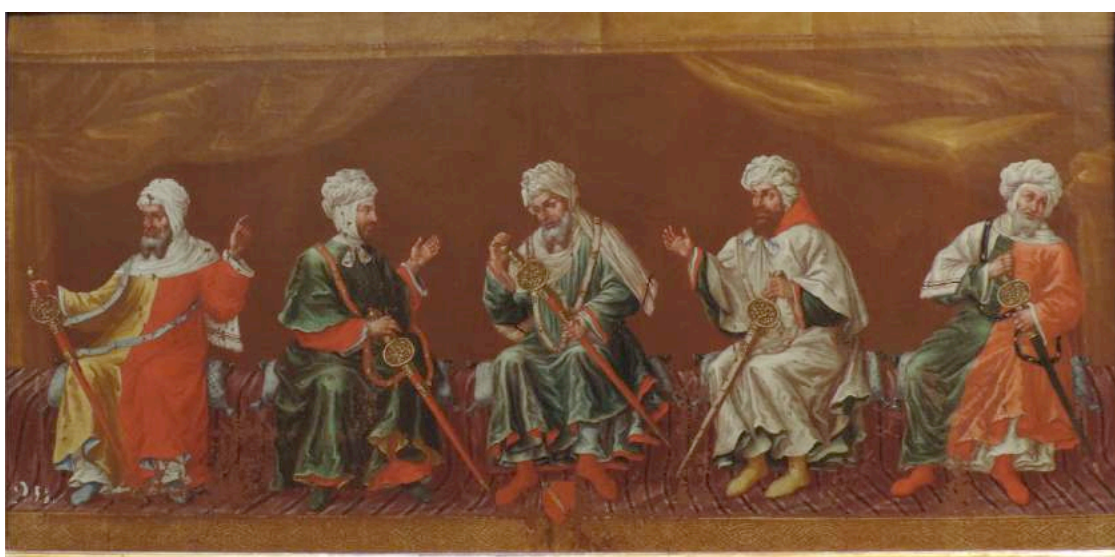
Interpretación realizada por Sánchez Saravia en el S-XVIII, Escena de 5 personajes (reyes o doctores de la iglesia) sentados. Óleo sobre tela. Real Academia de Bellas artes de San Fernando (Madrid)