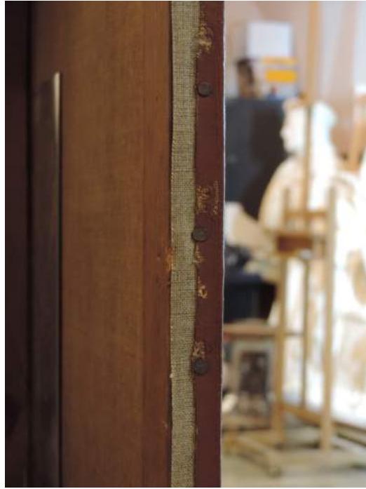
Detalle del borde donde se aprecia de color claro la banda de tensión perimetral.