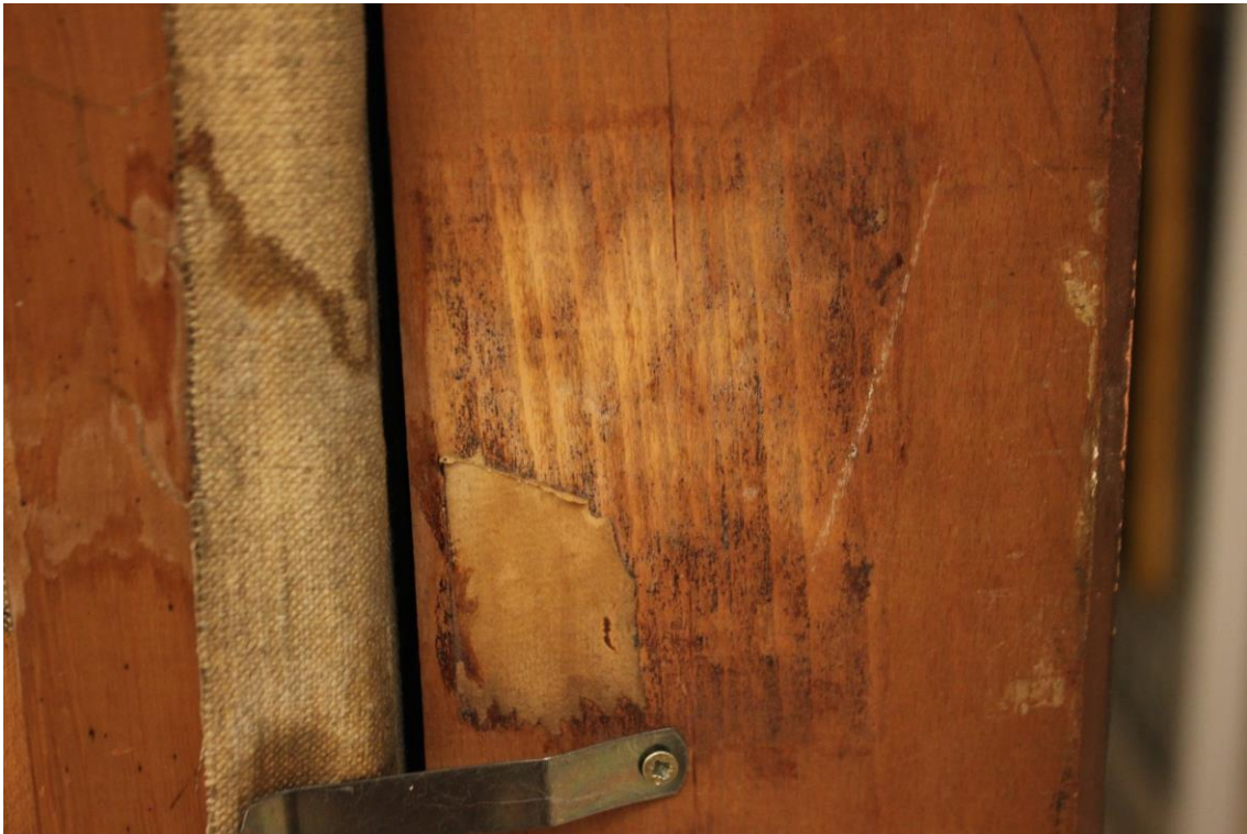
Restos de una etiqueta antigua.