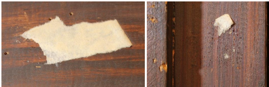
Restos de etiquetas eliminadas