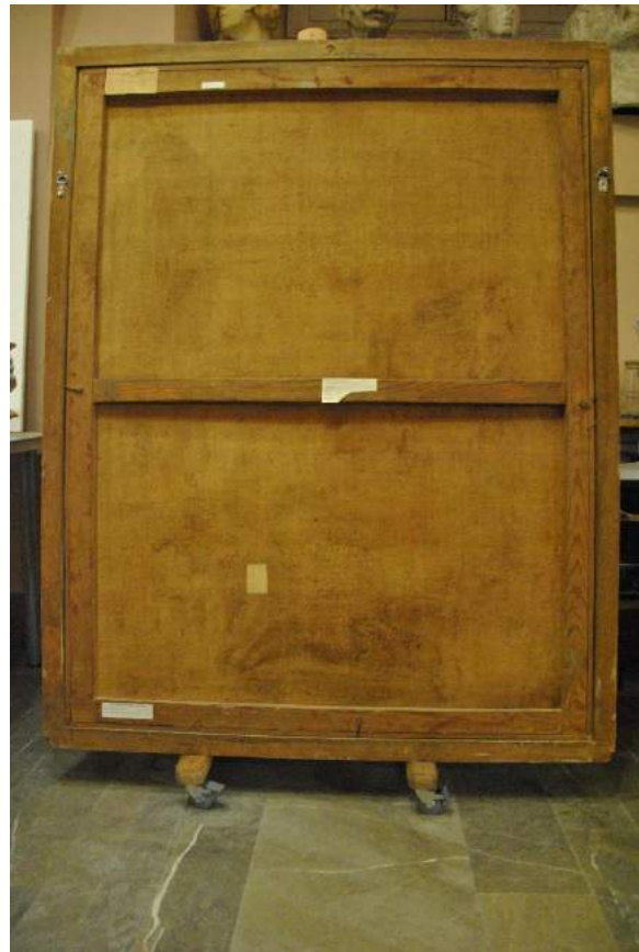
Fotografías iniciales del anverso y el reverso de la obra.