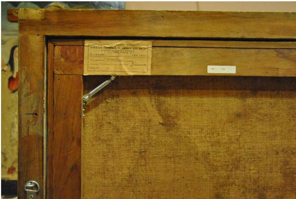
Detalle de los tensores.