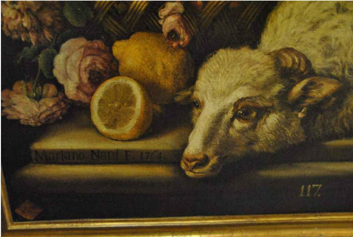
Firma del autor y otros nº de inventario.