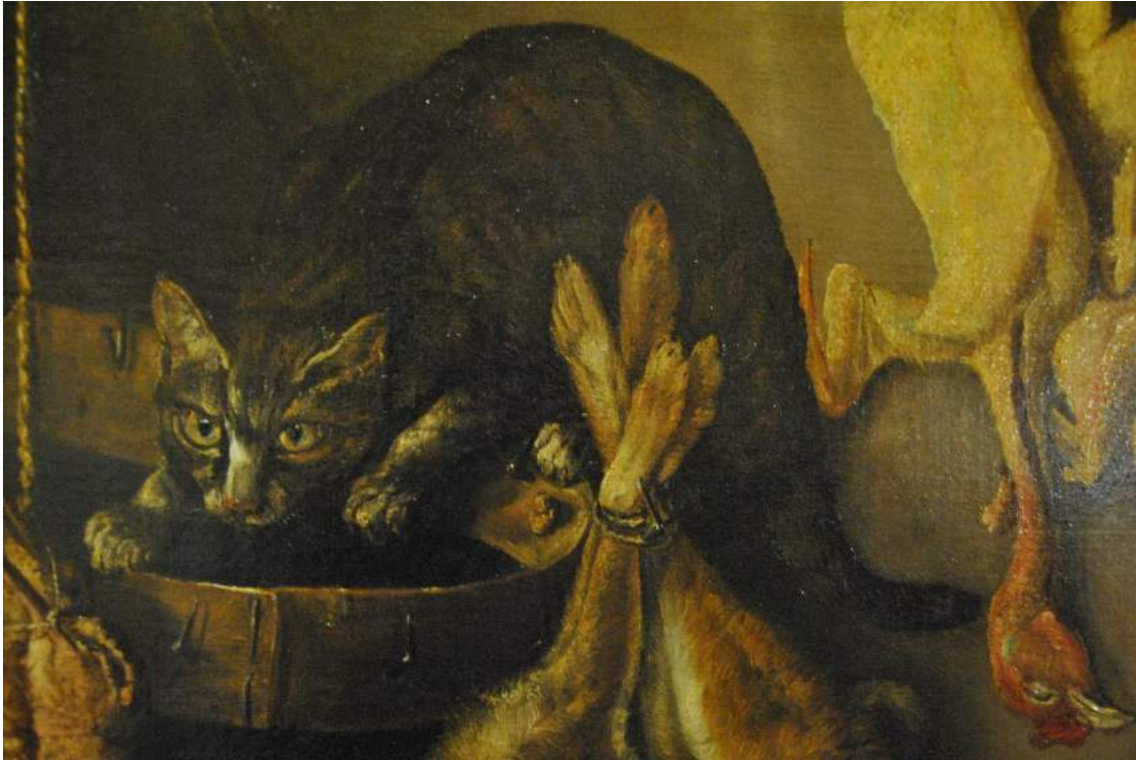
Detalle inicial se aprecia la oxidación del barniz.