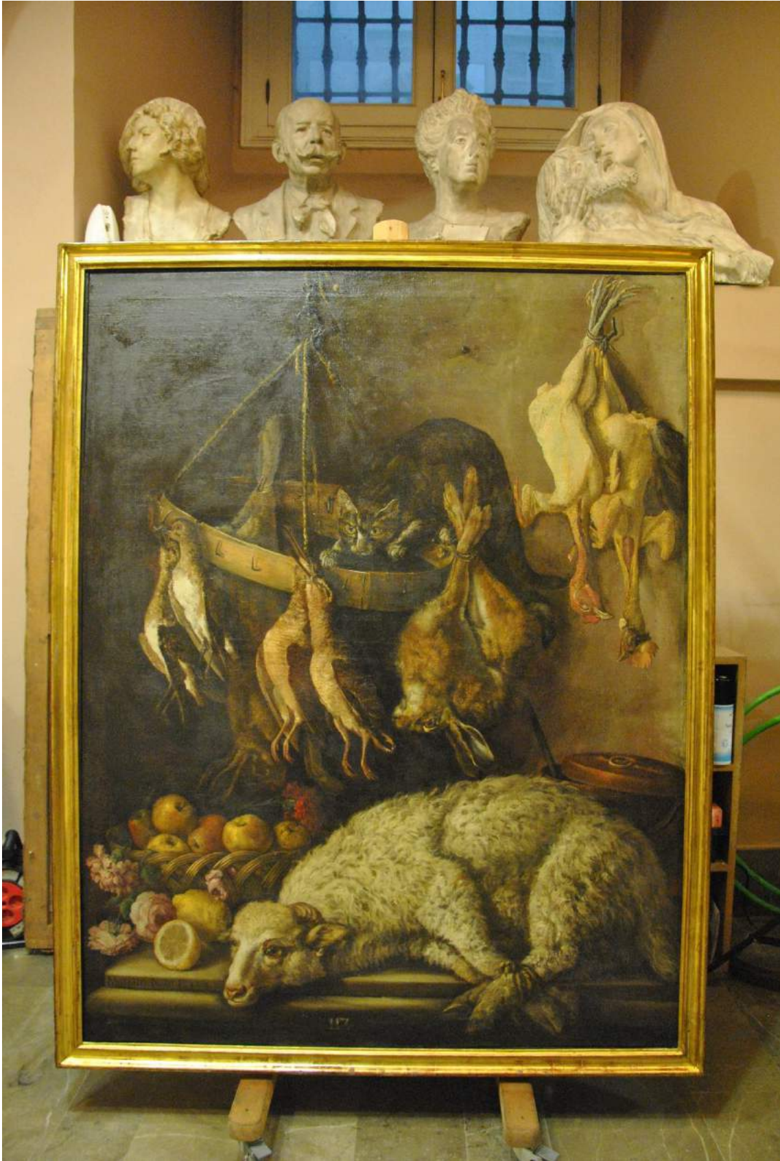
La obra una vez finalizados los procesos de restauración.