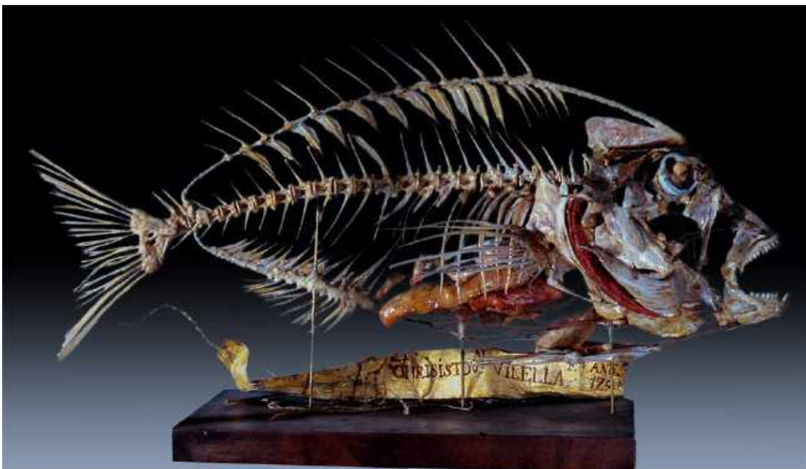
Pargo ( Pagrus pagrus ) montado por Cristóbal Vilella en 1790. Colección de Ictiología del MNCN.

https://www.mncn.csic.es/es/comunicacion/blog/un-pez-historico-que-ilustra-la-union-entre-la-ciencia-y-el-arte