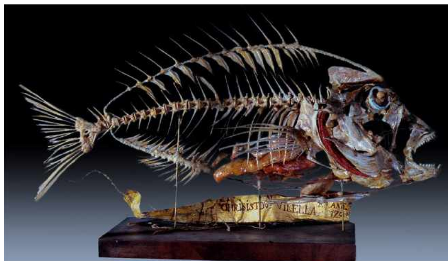
Pargo ( Pagrus pagrus ) montado por Cristóbal Vilella en 1790. Colección de Ictiología del MNCN.