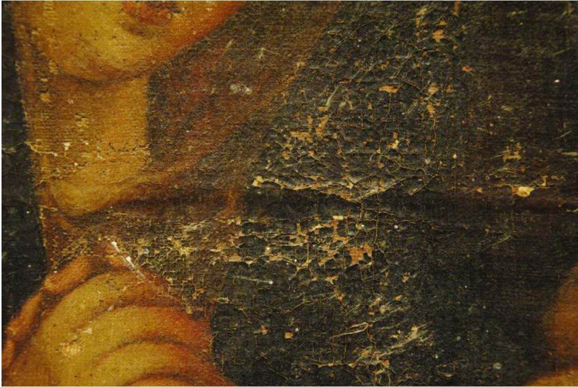
Macrofotografía, marcas de la costura.