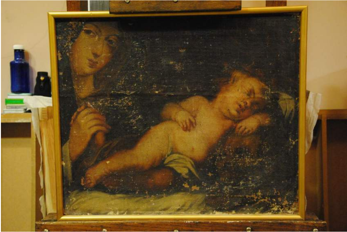
Fotografía inicial del anverso de la obra