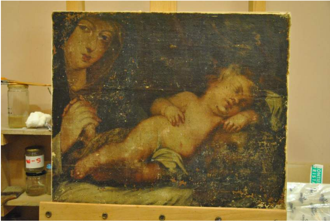
Fotografía final anverso de la obra.