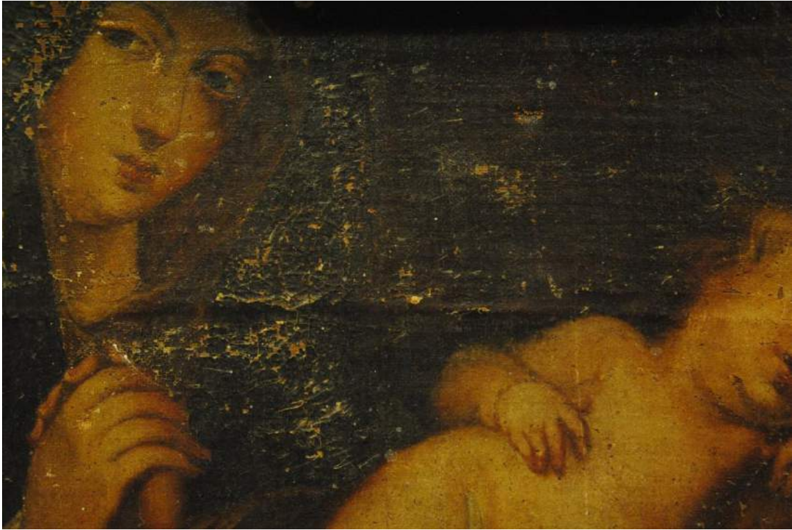
Detalle de las pérdidas de la capa pictórica.