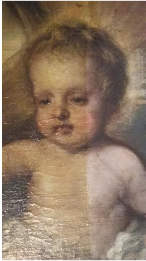
Detalle del proceso de limpieza del barniz. Craquelados de la superficie pictórica.