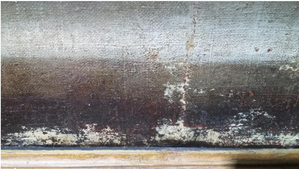
Detalle de pérdidas y trama del soporte.