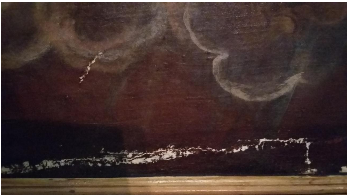
Saneado de estucos de intervenciones anteriores.