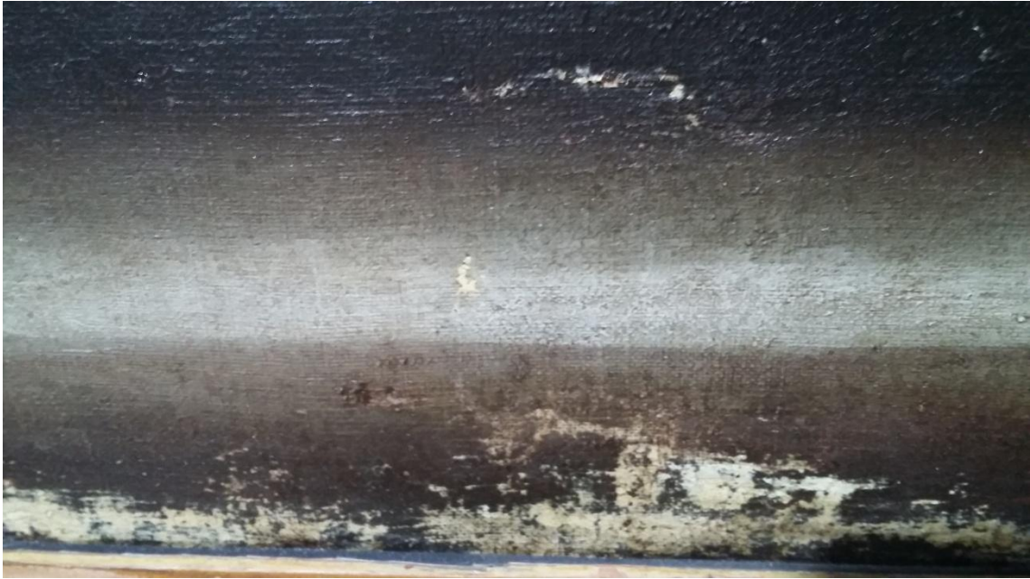
Detalle del estado de conservación. Levantamiento de película pictórica, manchas y estucado de intervención anterior.