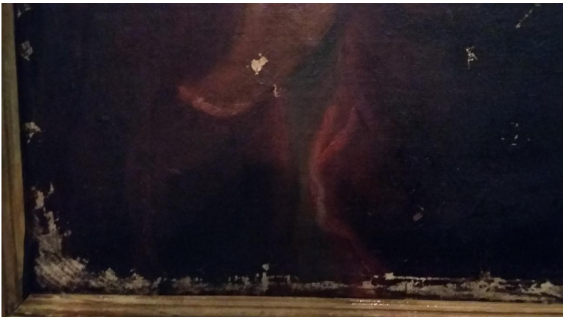
Judit Gasca Miramón