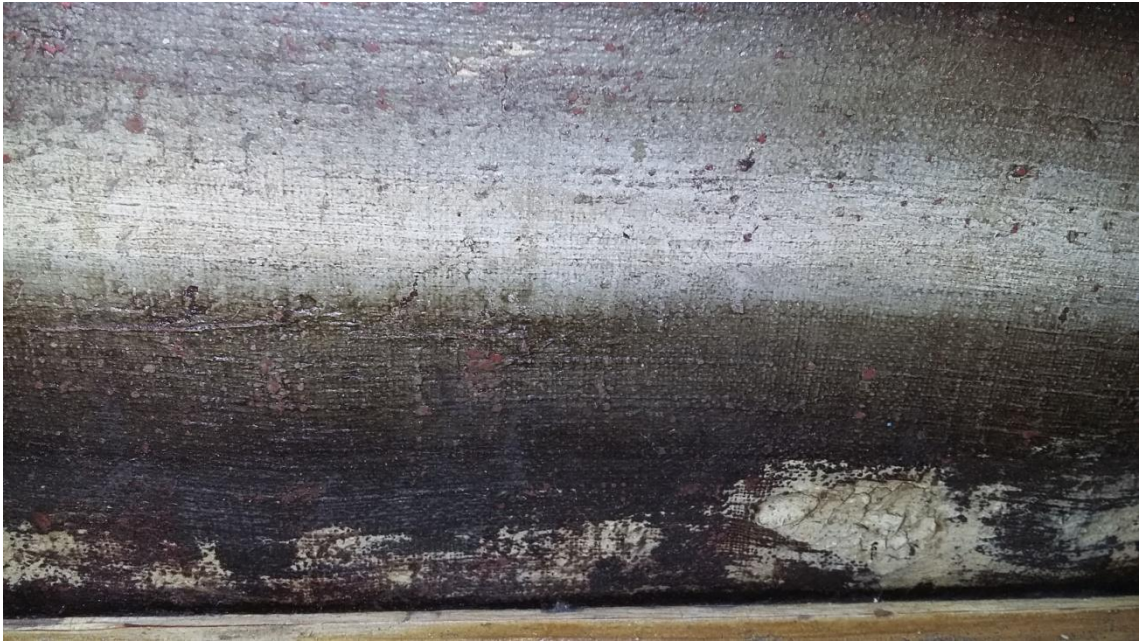
Detalles del estado de conservación de la superficie pictórica