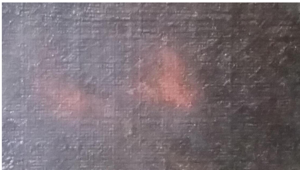
Judit Gasca Miramón