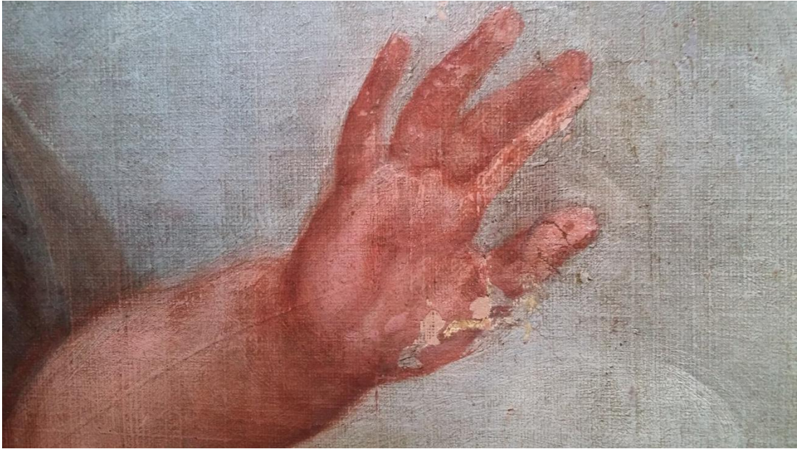
Detalle de estucado.