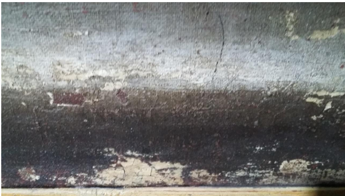
Detalle del estado de conservación. Craquelados, grietas y estucado de anterior intervención.

En la parte inferior, y debido en parte a la falta de tensión y peso del lienzo, se observan amplias zonas de levantamientos de importancia de la capa pictórica, en sentido longitudinal. En algunos casos se ha producido desprendimiento de policromía y preparación.