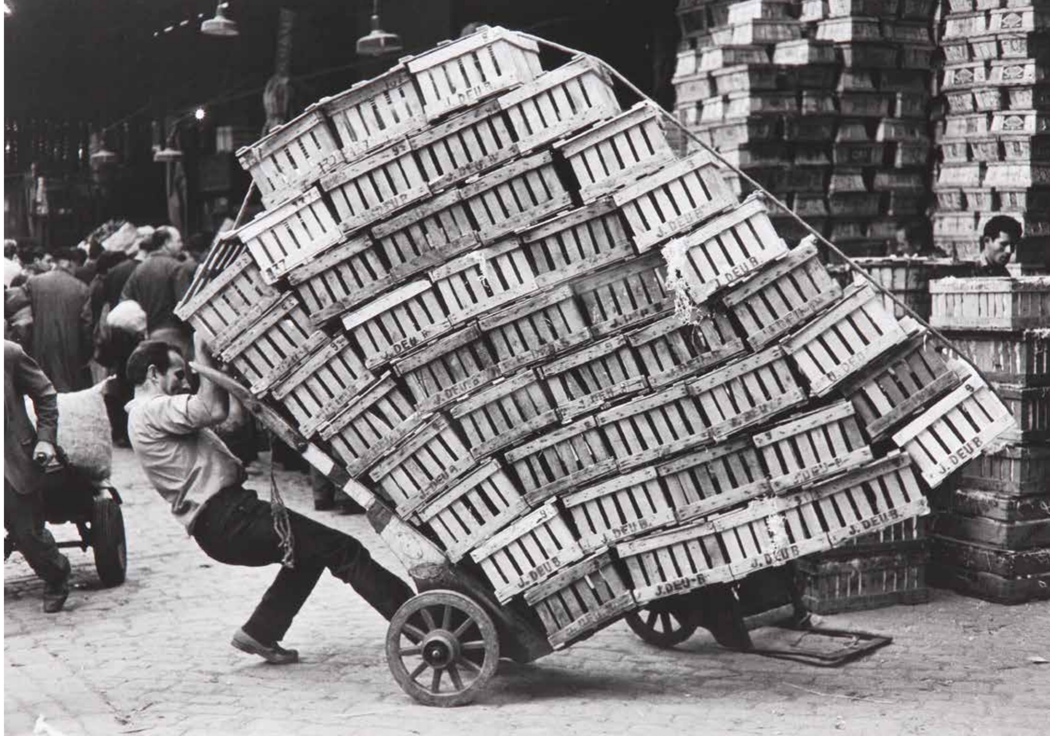
El Born (Barcelona) , 1962 (copia positivada en el estudio de Manuel Serra, 2005), adquirida en 2006 con cargo a la Herencia Guitarte.

La creación del Grupo Afal favoreció también una apertura de espíritu, que a él le venía casi “de serie”, empezando por los aires sureños de Almería –la revista se creó en la agrupación almeriense–, donde cuajó esa “familia” fotográfica deseosa de renovación, llena de entusiasmo y de fe en la fotografía como medio de expresión creativa llamado a entrar en el arte por la puerta grande. Aunque él no pensaba en el arte ni en la fotografía artística, porque su afán era ser un buen profesional en su campo, captar el aire de los tiempos y dejar a otros que leyeran e interpretaran lo que podían ver en sus imágenes. Entre los fotógrafos participantes en la revista se encontraban, además de Miserachs, Joan Colom, Gabriel Cualladó, Paco Gómez, Ramón Masats, Carlos Pérez Siquier, Alberto Schommer, Oriol Maspons, Ricard Terré, Francesc Català Roca, Gerardo Vielba, Leopoldo Pomés, Ramón Bargués y Francisco Ontañón,