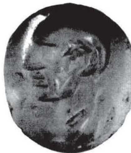
Figura 3.—Zafiro grabado con busto varonil (N.º Inv. 1995/74/19), MAN, Madrid.

La asturiana era una cruz-relicario, según lo demuestran los receptáculos con tapa corredera excavados en la parte más ancha de los brazos y en la cabecera. Tenía también tres ojetes en el borde inferior de cada brazo, donde irían anelados, según Schlunk, colgantes al estilo de los que exhiben las pequeñas cruces de Guarrazar. El sabio germano descarta la opinión de Amador de los Ríos, quien sostenía que la cruz habría tenido pendientes el alfa