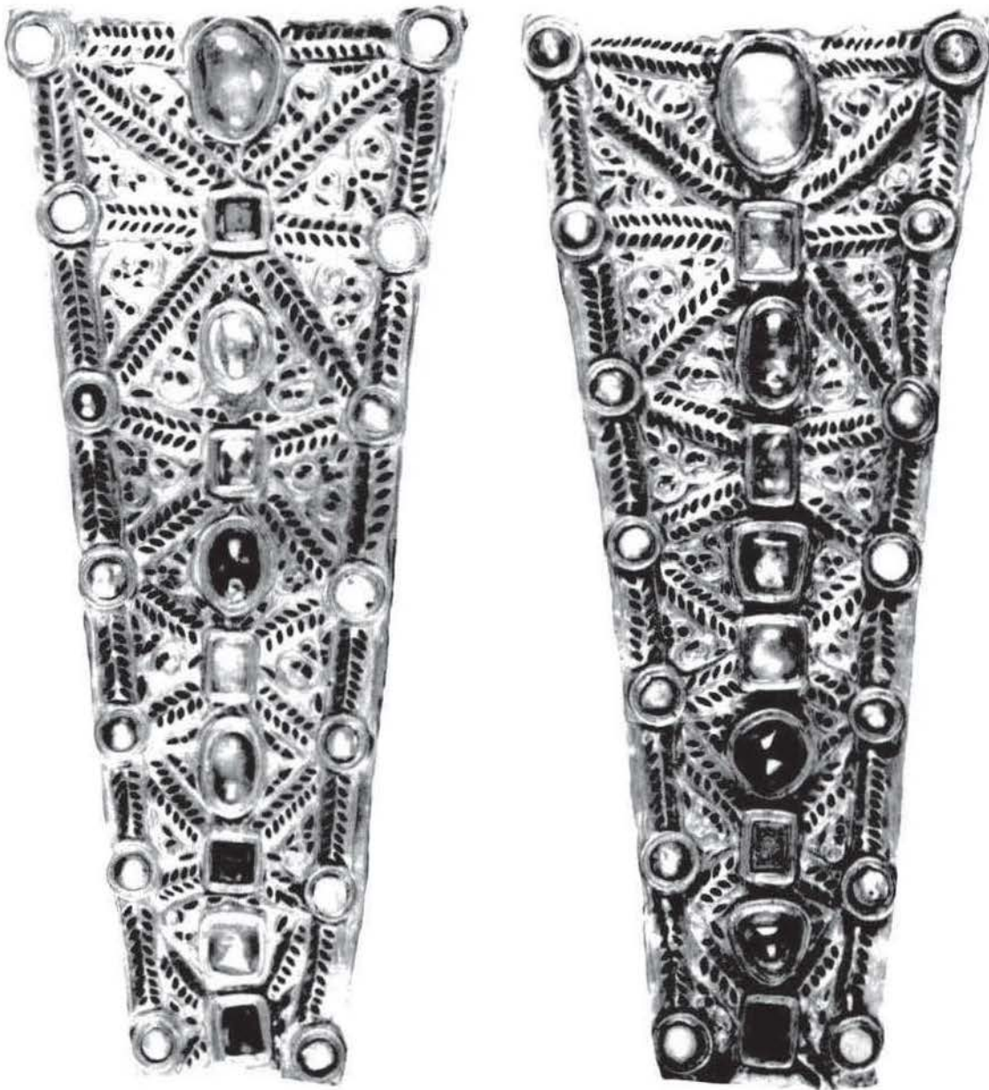
Figura 2.—Láminas de revestimiento de gran cruz (N o Inv. 52.565). MAN, Madrid.

pediente judicial y los fragmentos presentados en este Ministerio por el platero Navarro, calcula el Negociado que ellos fueron los primeros hallados por los vecinos de Guadamur; «[...] que dislocados los otros tres brazos de la cruz, llamaron la codicia de los inventores y estos, arrancando las piedras preciosas, machacaron el oro y le vendieron en Toledo. En el centro de la cruz debió haber un relicario y quizás los pedacillos de carbón sean reliquias...» ¿Cómo llegaron a Navarro los fragmentos de gran