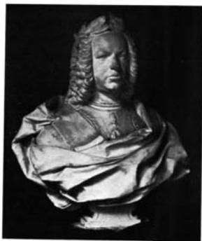
Madrid. Academia de San Fernando: 1. Bárbara de Braganza. Yeso.—2. Fernando VI. Yeso.