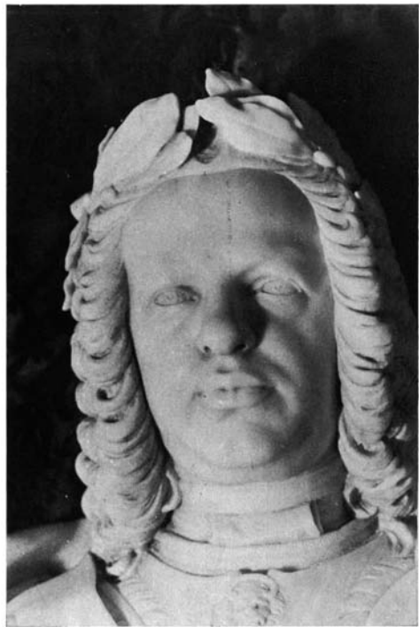
1. Madrid. Salesas Reales. Fernando VI. Mármol.—2. Detalle del mismo.