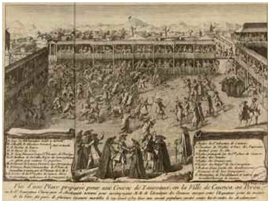
Grabado de una plaza en Cuenca preparada para una corrida de toros.

espionaje en Londres. En más de una ocasión la policía le pisó los talones. Tuvo que cambiar de nombre y de domicilio y, burlando a sus perseguidores, salió de Inglaterra disfrazado de marinero raso a bordo de un buque mercante.