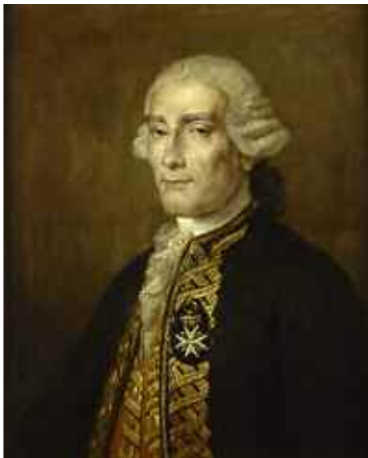
Retrato de Jorge Juan de Santacilia, por Rafael Tejeo. (Museo Naval de Madrid).

En el ámbito de la Armada existen tres óleos en Cartagena, dos copias del realizado por Tejeo y otro anónimo del siglo XIX (en la residencia del almirante del Arsenal); en los edificios de las antiguas Capitanías Generales de Ferrol y San Fernando existen sendos óleos anónimos del siglo XIX, y en el Real Observatorio, dos óleos del siglo XX, También hay catalogado un óleo en la Escuela Naval, y otro, de García Candoy, en la Comandancia Naval de Alicante.