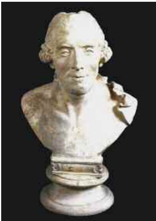
Busto de Jorge Juan.