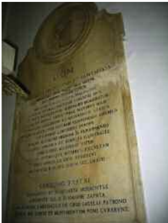
Lápida de la tumba de Jorge Juan en el Panteón de Marinos Ilustres de San Fernando.

familia no quería hacerse cargo de ese gasto: «...Dn. Antonio de Ulloa tiene escrito aquí se esté à la mira de si no lo hacen los Parientes, para si no hacerlo él; cosa que no parece decente dar lugar a ello».