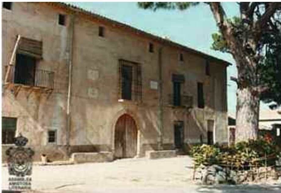
Casa de Jorge Juan.

de la herencia. José, de 15 años, se encontraba de paso hacia Cádiz para ingresar en la Compañía de Guardias Marinas.