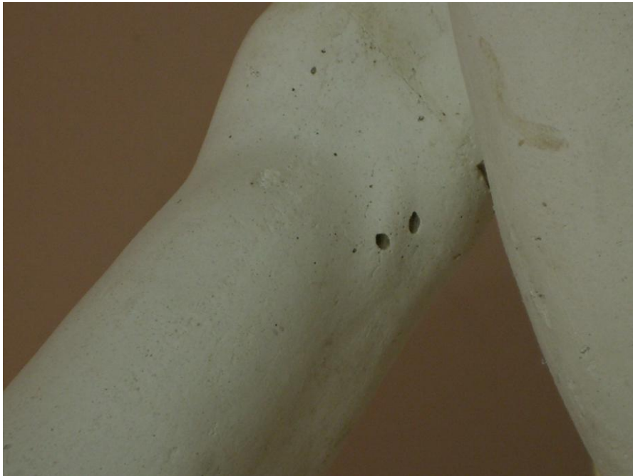
Coqueras producidas durante el fraguado