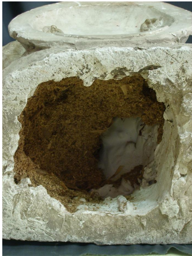
Detalle del serrín del interior