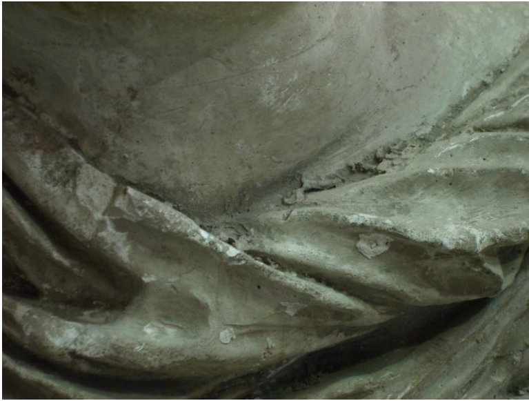
Detalle de depósitos sobre la superficie