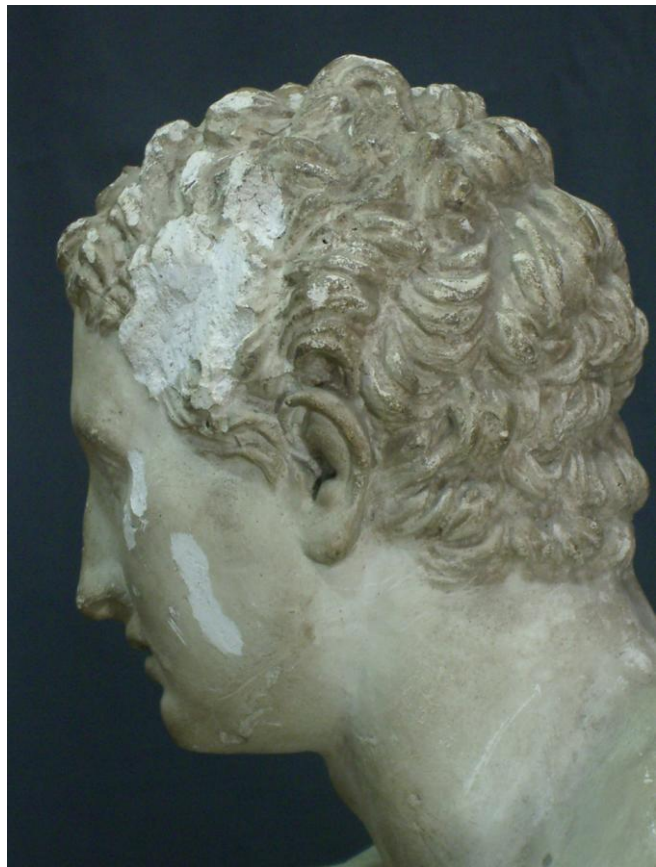
Rozaduras y desgastes