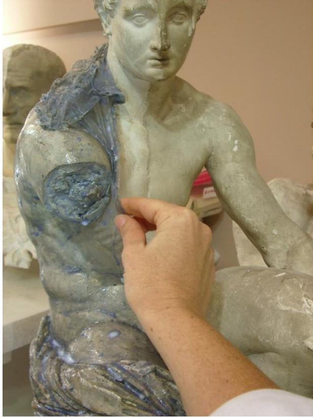
Proceso de limpieza