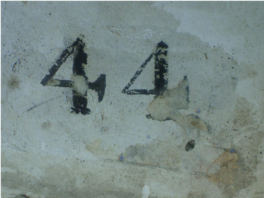
Detalle del número de inventario y restos de papel de antiguas etiquetas