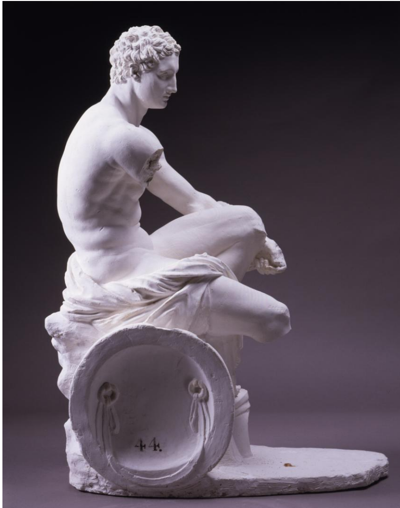
Foto final tras el proceso de restauración