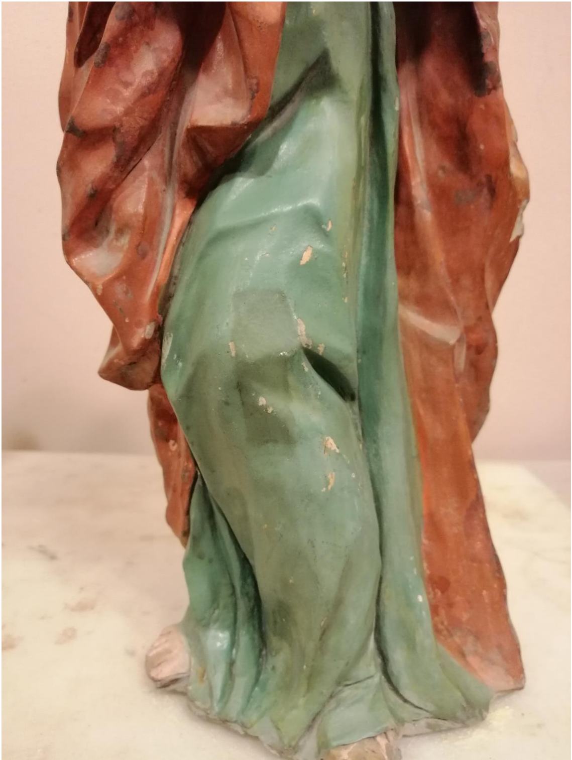
Judit Gasca Miramón