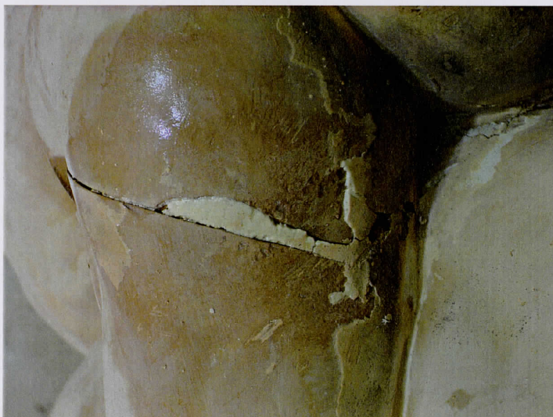
Detalle rotura y estucos antiguos