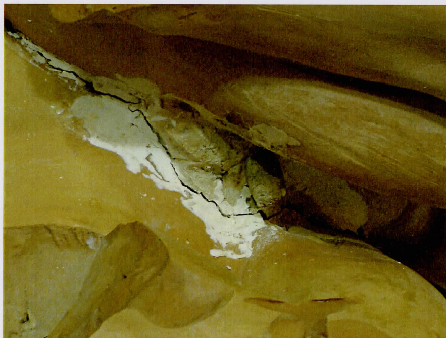
Detalle de roturas y reintegración volumétrica