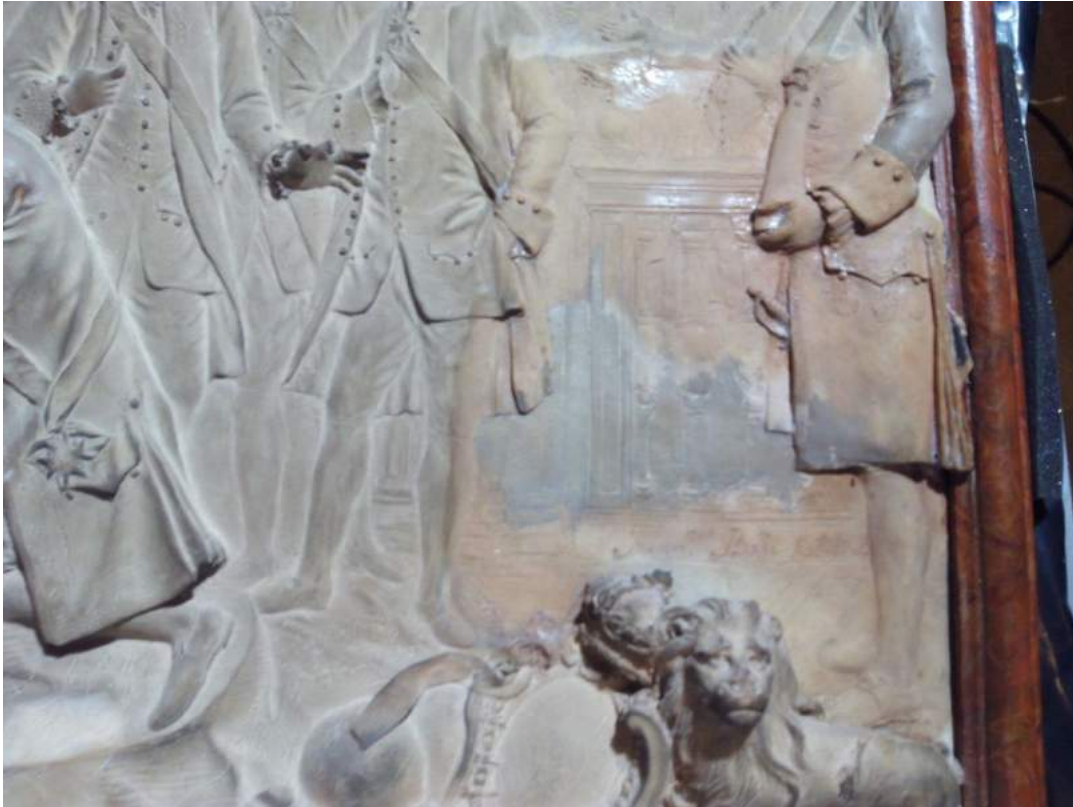
Detalle de repintes