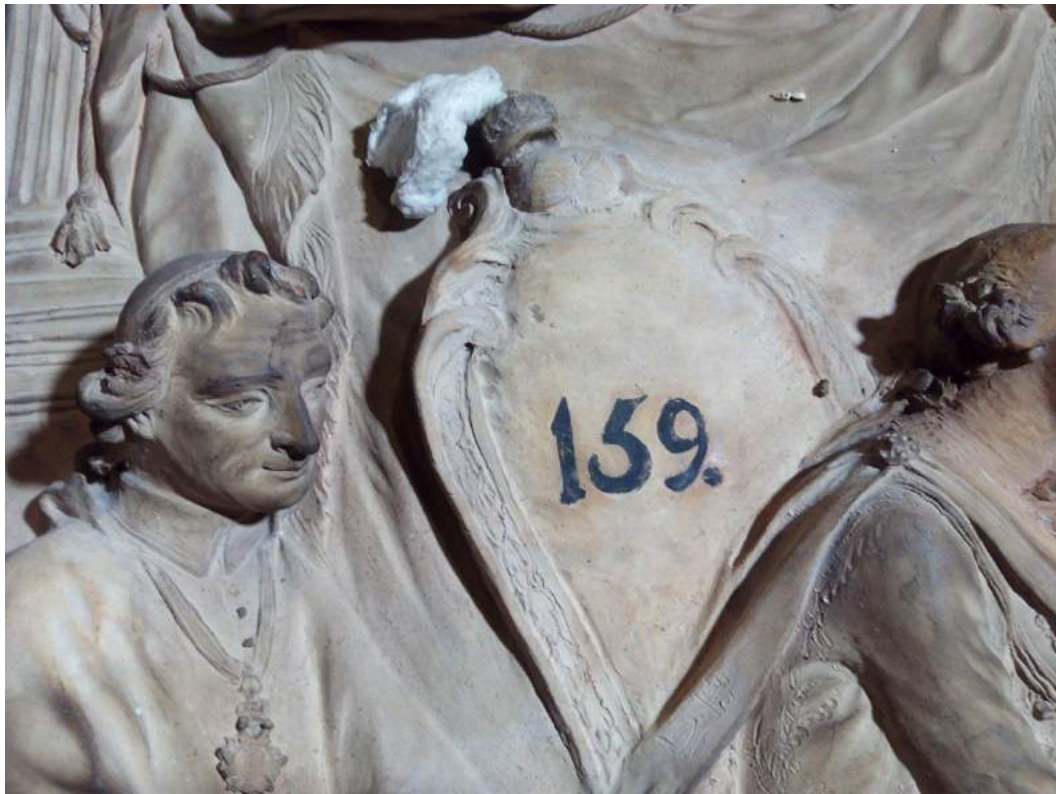
Detalle nº de inventario de 1808