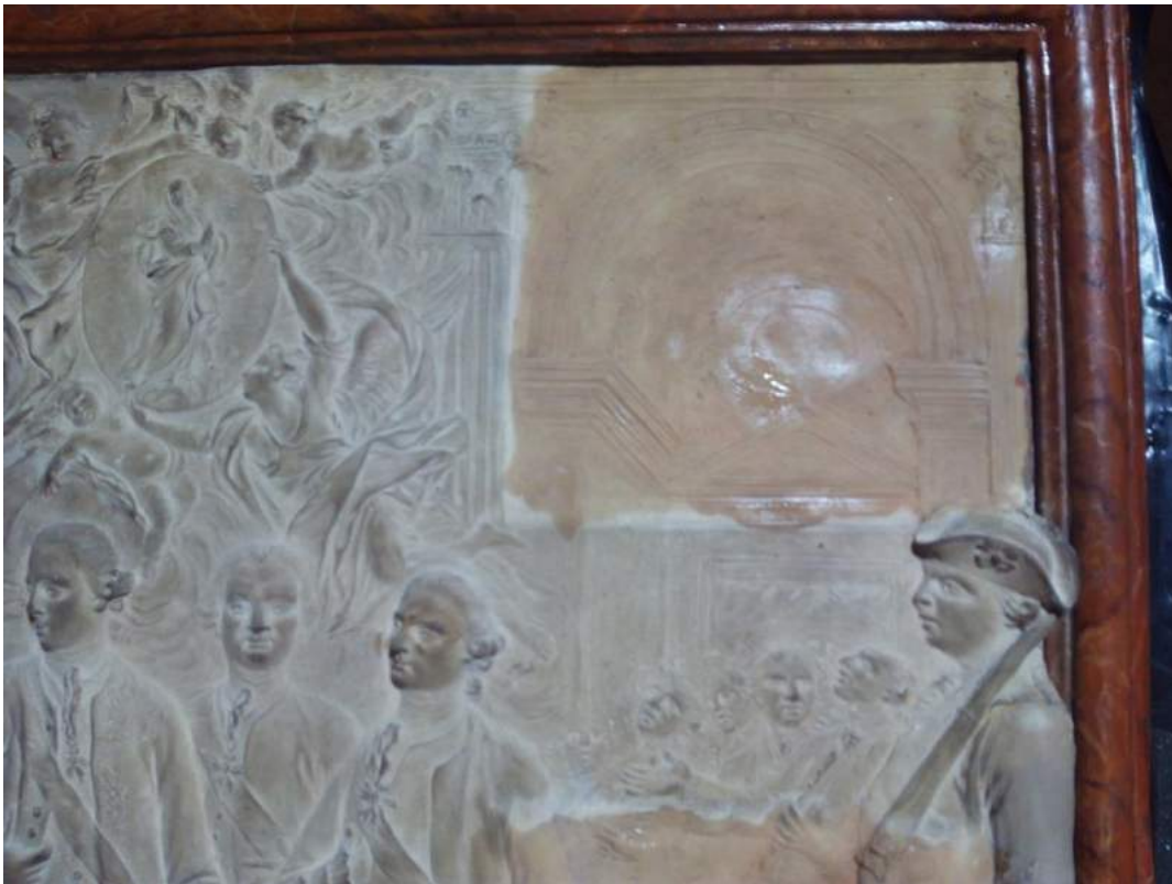
Detalle, eliminación de las capas ajenas a la obra