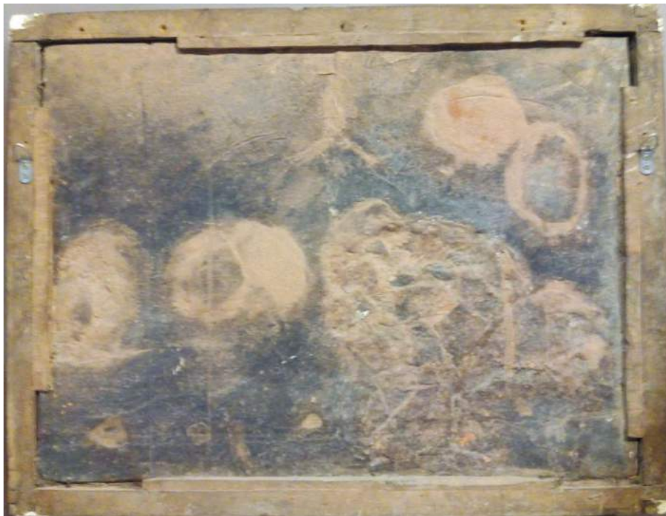
Reverso de la obra