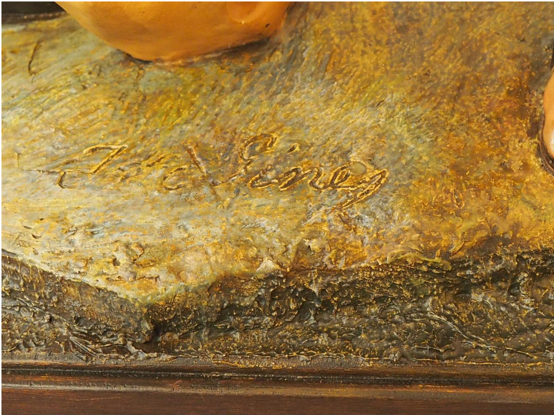
FIRMA J GINÉS E 89