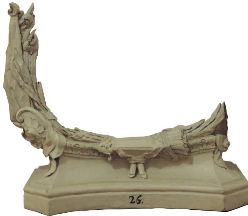
Una vez finalizada la restauración.