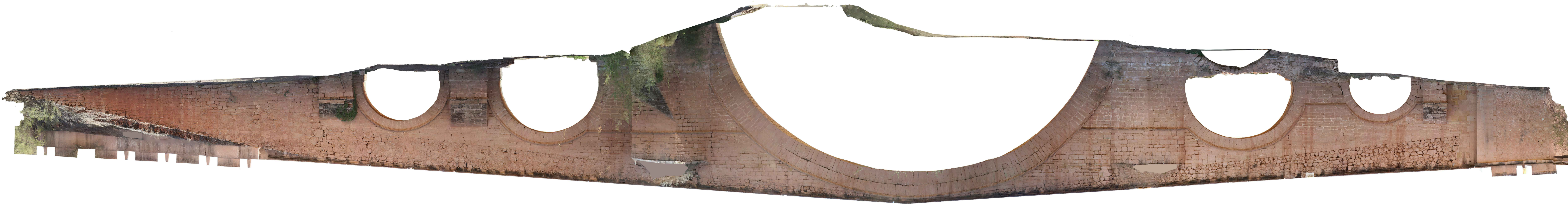
SECCIÓN HACIA SUR