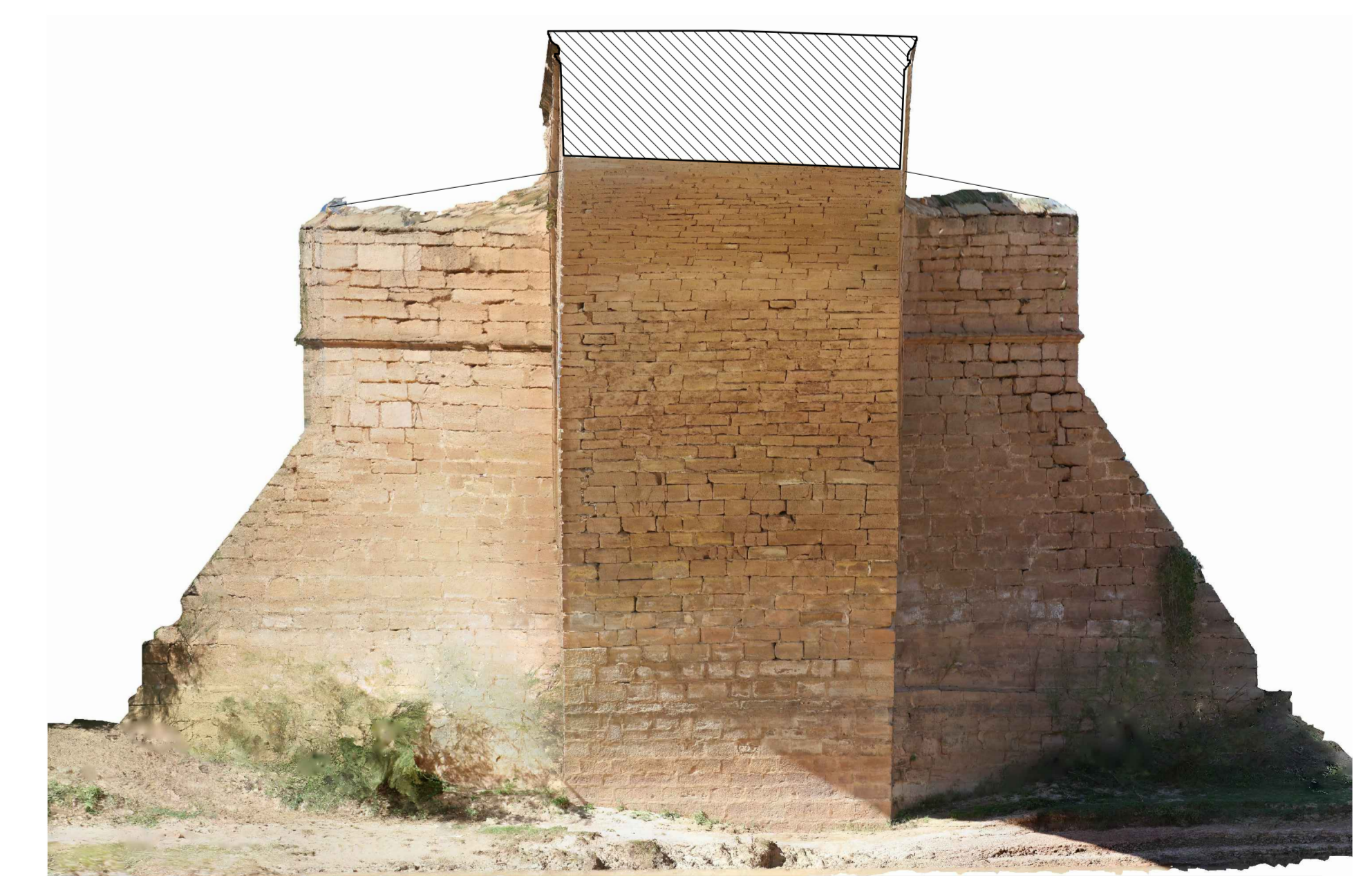
SECCIÓN HACIA NORTE