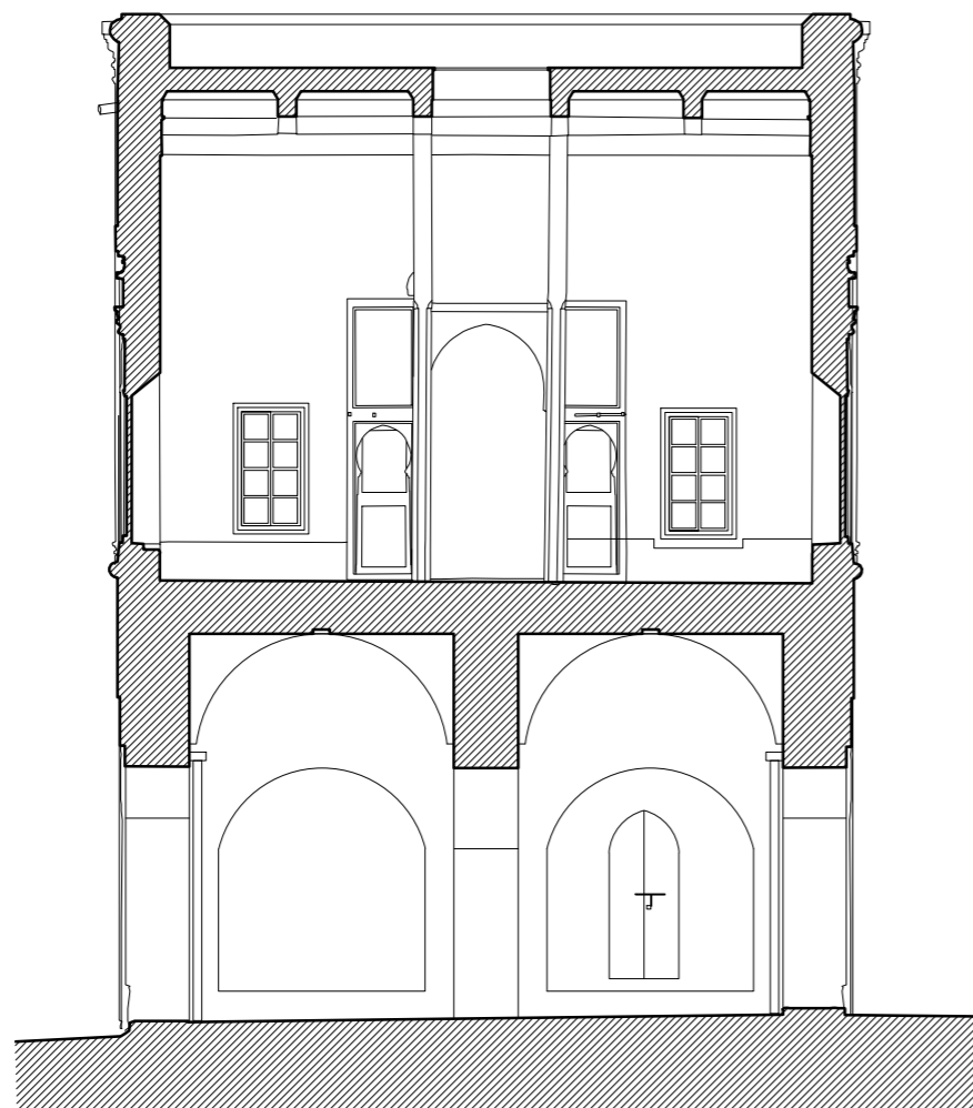
Sección N-S hacia Este