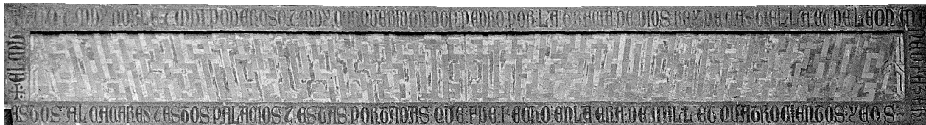
MORENO, hacia 1910