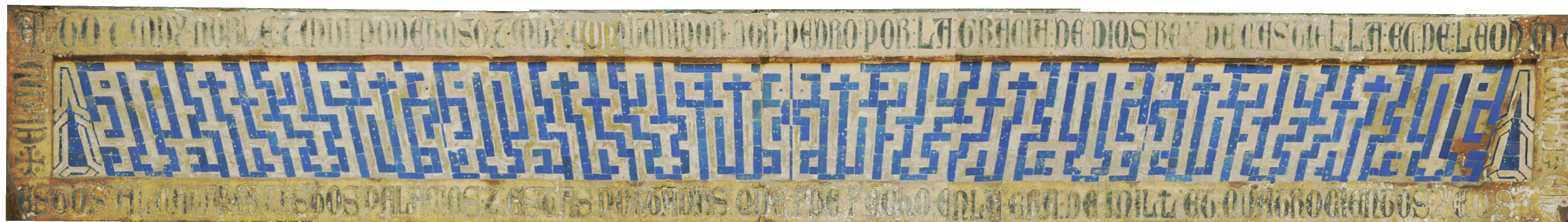
antes de la restauracion de 2008