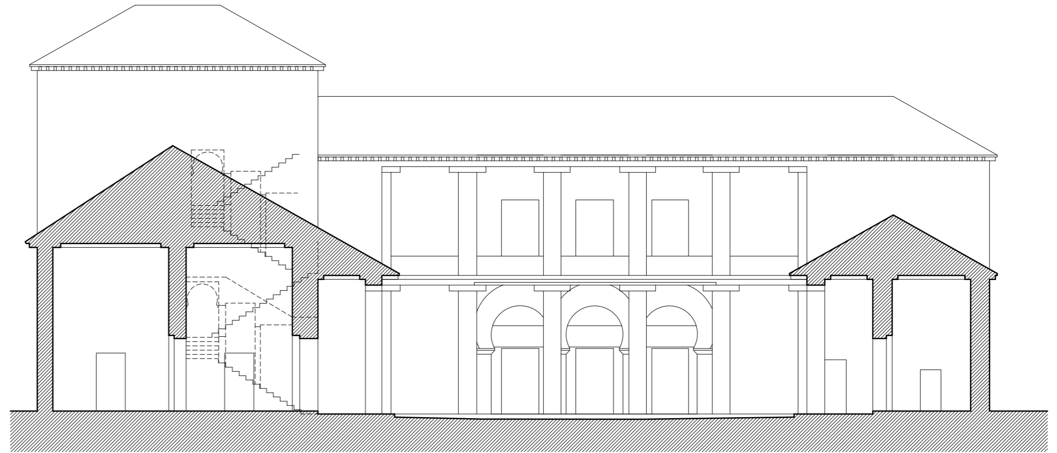
SECCIÓN B HIPÓTESIS